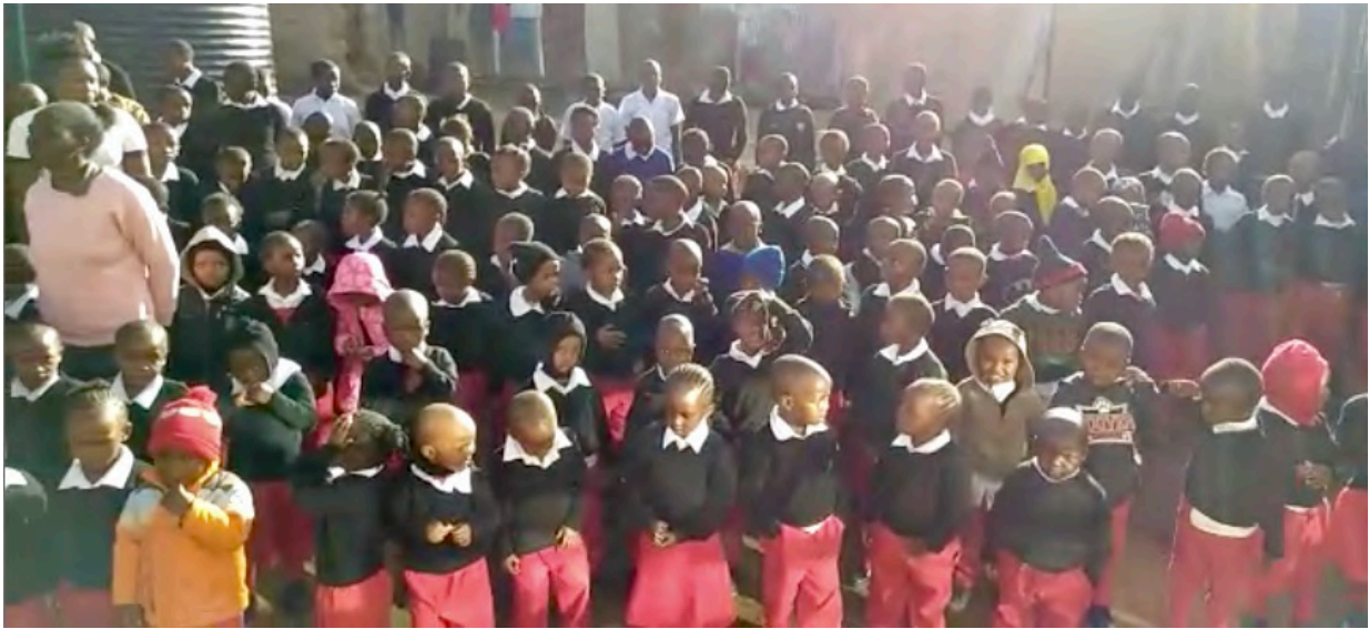
Kenian slummin koululaiset

KENIAN köyhät ja nälkähädässä olevat asukkaat slummeissa ovat uusi työalueemme. Myös Keniassa on ollut mellakoita ja vaikeuksia. Herran työ etenee vahvalla muslimialueella. Ihmisiä tulee uskoon. Sanaa opetetaan päivittäin ja Herran rakkaus ja valo vetää ihmisiä voimakkaasti puoleensa.