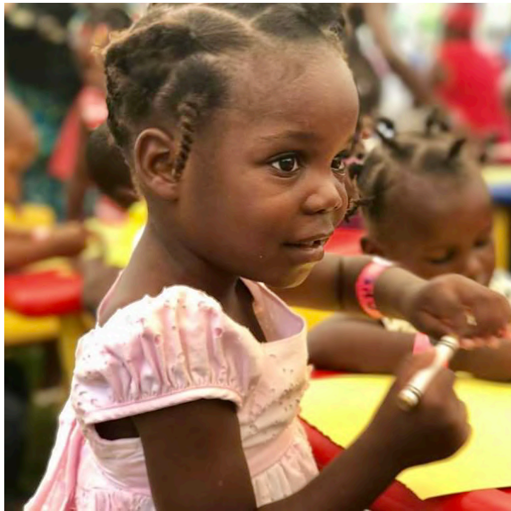
Pieni tyttö pääsiäiskorttia tekemässä